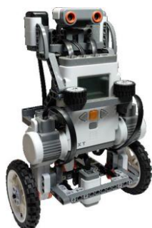
教育用レゴ™マインドストーム™NXT